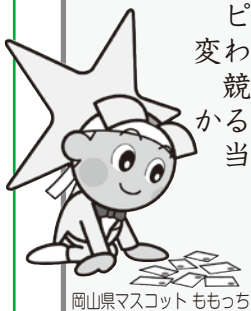
岡山県マスコット ももっち