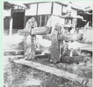
海中から発見された鳥居の根元部分