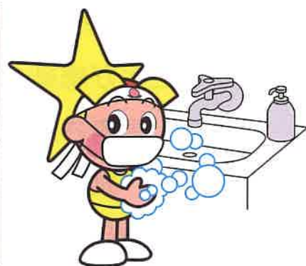
「岡山県マスコット ももち」