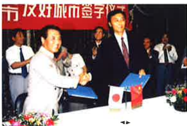
1996年10月5日，九江市与玉野市在九江簽署两市建立友好城市关系协议书。