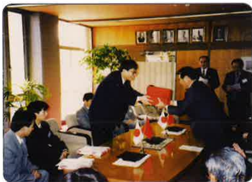
1995年11月，九江市第一批研修生拜访玉野市前任市长山根敬则。