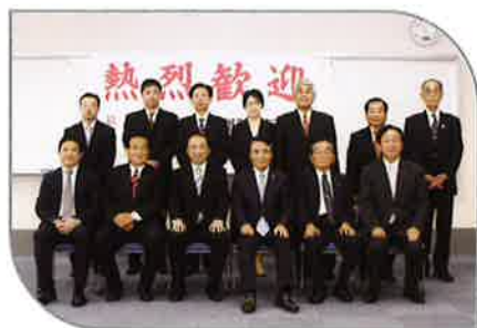
2014年9月，九江市友好访问团访问玉野市日中友好协会。