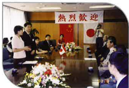
2003年8月，时任九江市市长蔡晓明率团访问玉野市。