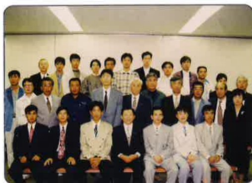
1997年11月，玉野商工会为研修生举行欢送仪式时的合影。