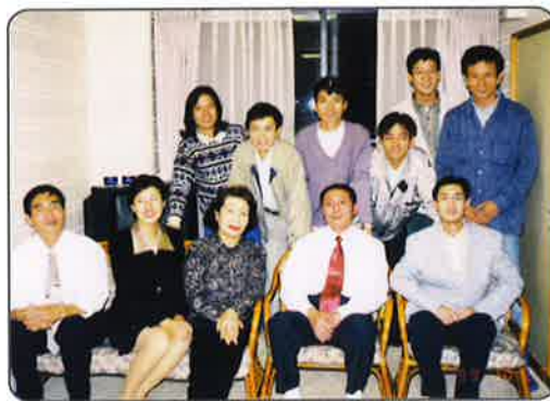
1999年11月，九江市教育代表团访问玉野市时看望我市研修生。