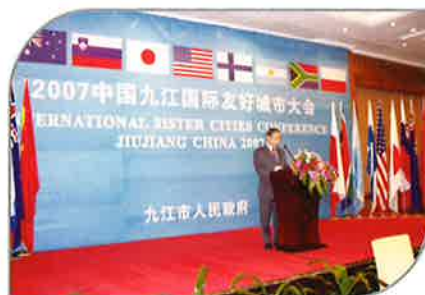
2007年10月，玉野市原副市长须田纪一在九江市国际友好城市大会开幕式上致辞。