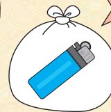
使い捨てライター

中身は使い切り、屋外などの風通しが良く、火気のないところで穴をあけてガスを抜いてください