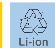
リチウムイオン電池