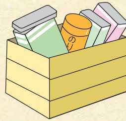
のり・菓子などの缶