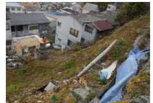
高台から瓦礫や岩石、柵等が落下するおそれ