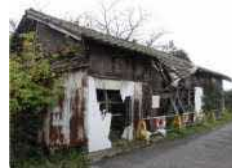
建築物のイメージ