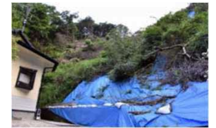
豪雨の度に土砂崩れが多発