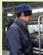
製造課 / 11年目