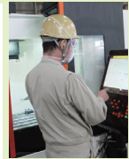
Y・K / 20年目