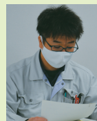
O.H君 / 9年目