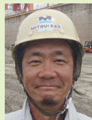
M・S / 4年目

7:00 車で通勤し駐車場より自転車に乗り換え事務所に出勤 8:05 体操を行い、作業前ミーティング 8:20 現場での作業開始 12:00 昼休憩 13:00 作業前ミーティングを行い、午後の作業開始 16:50 翌日の打ち合わせを行う。 17:00 仕事終了 17:30 翌日の準備をして帰社