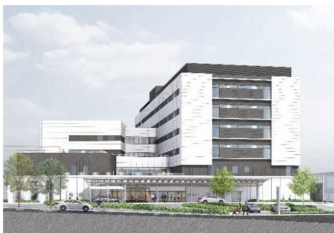
新病院完成イメージ