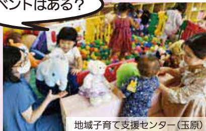
地域子育て支援センター(玉原)