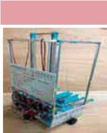
▲完成した「ヘルメス 2023号」