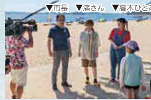
渋川海岸でのロケの様子

来場客の皆さんに話を聞いていると、私が観光大使になったことを知ってくれている人がいて嬉しかったです。隣にいた玉野市長のことは知らなかったのに…市長!早く私に追いついてくださいね(笑)