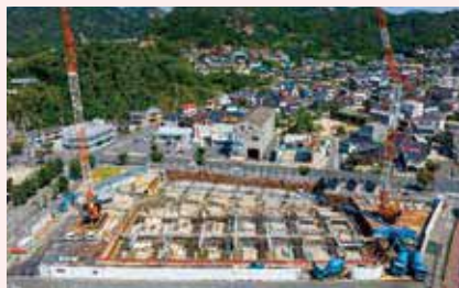
【建設現場の様子(8月21日)】