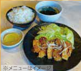
※メニューはイメージ

「お肉に人生を捧げ、お肉で玉野を笑顔あふれる街に。」を目指して、おいしいお肉をお届けします。仕入れや切り方にこだわったお肉やオリジナルのたれなど、最高の食材とおもてなしで、お待ちしております。※提供メニューは、Instagramをご確認ください。