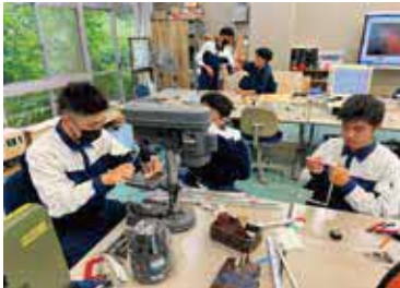
▲ロボット製作の様子