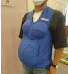
パートナーの妊婦体験