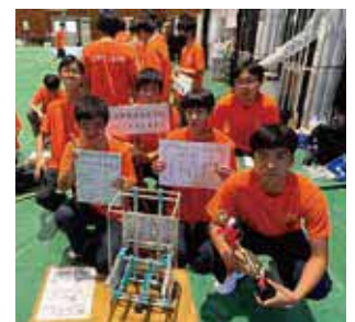
▲3位入賞の記念撮影