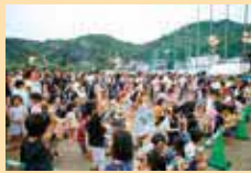
▲令和元年に実施した様子

※駐車場は玉野競輪場第3駐車場を利用してください。会場まではシャトルバスがあります。