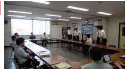
▲協賛企業へプレゼンテーションする様子

資金調達から製作までの一連の流れを経験することで、ものづくりの知識や技術だけでなく、地域や企業、団体とのつながりの大切さなどを学ぶことができました。ご協力いただいた皆さん、ありがとうございました。