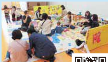
5月に実施した「いっしょにあそぼ!」の様子

10月は「いっしょにあそぼ!」を開催します。詳しくは、19ページをご覧ください。