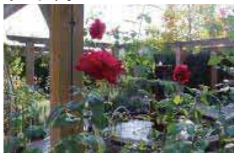
▲深山イギリス庭園(田井2-4490)

庭園内のローズガーデンでは、10月中旬のバラの開花時期に合わせて様々なイベントが開催されます。ぜひご参加ください。(関連記事6ページ)