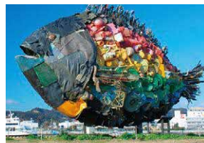
宇野の子 / 渋川テクニク

宇野港周辺は3年に1度開催される芸術の祭典「瀬戸内国際芸術祭」の会場のひとつとなっており、「宇野の子」や「愛の女神像」、「舟底の記憶」を始めとしたアート作品がたくさん点在しています。彩り豊かな宇野港周辺で、海風を感じながら玉野のアートをゆっくりと鑑賞ください。