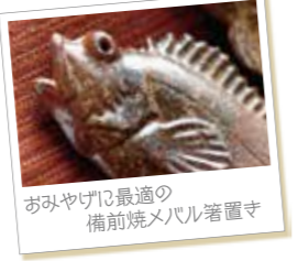
おみやげに最適な備前焼メバル箸置

びぜんやき-おうじがま 玉野市永井2763 王子が岳山頂 問:086-477-3773 営業時間:10:00~17:00 定休日:火曜