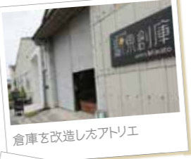
倉庫を改造したアトリエ

えきしがしろうこ 玉野市築港5-4-1 問:0863-32-0081 営業期間:10:00~17:00 休館日:火曜