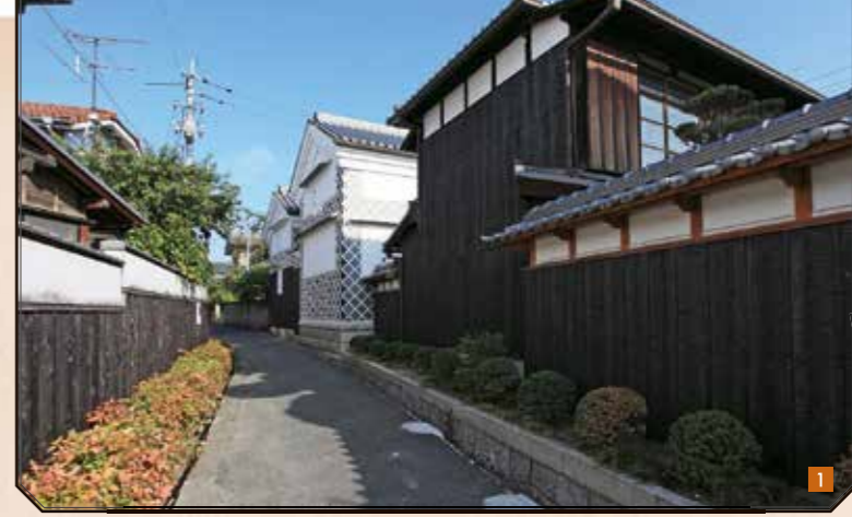
▲古の面影を残す八浜の町並み