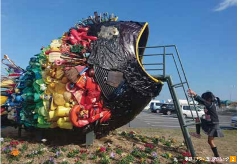
宇野コチヌ / 淀川テクニク 2 4 舟底の記憶(いかり) / 小沢敦志