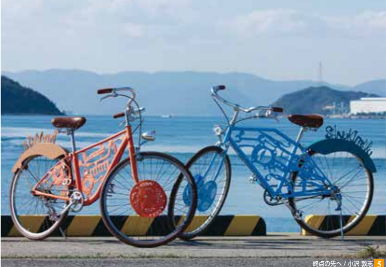
終点の先へ / 小沢 敦志 5 6 JR宇野みなと線アートプロジェクト(宇野駅) / エステル・ストッカー