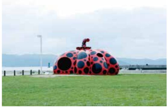
草間彌生「赤かぼちゃ」2006年 直島・宮浦港緑地

東児が丘マリンヒルズゴルフクラブ Tel.0863-41-2311 あの石川遼くんが、2007年マニシングウェアトーナメントで優勝したのはここ!17番バンカーは「はにかみバンカー」と命名されている。玉野東海岸側から瀬戸内が見渡せる。