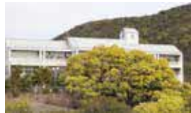
▲日比中学校(和田6-13-1)周辺