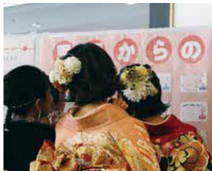
▲会場外に恩師からのメッセージ(手紙)を掲載

これからも前を向いて 式典終了後には、会場の外で久しぶりに再会した友人と思い出を語り合ったり、記念写真を撮影したりと、思い思いの時間を過ごす姿が見られました。 これからも、大人としての決意を胸に、それぞれの夢に向かって歩み続けてください。