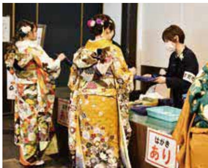
▲受付で記念品などを贈呈