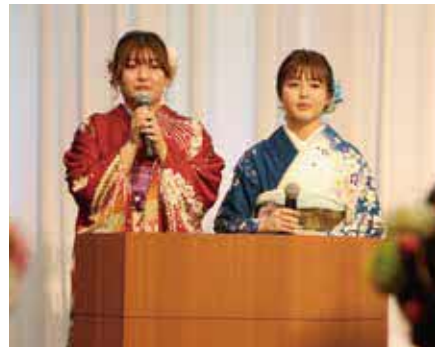
▲「はたちの集い」では司会がメッセージムービーを紹介