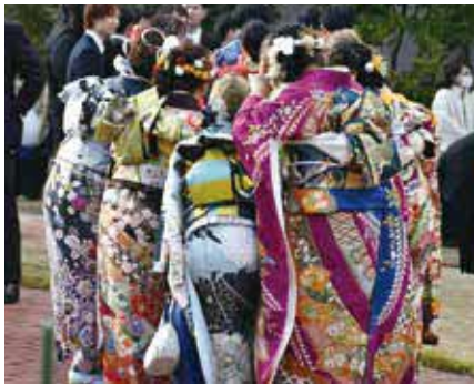
▲式典終了後に友人と記念撮影