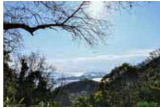
▲登山道からの景色

山頂から少し下った所にある日吉神社付近には山桜の大木が数本あり、春は、桜の名所として古くから知られています。