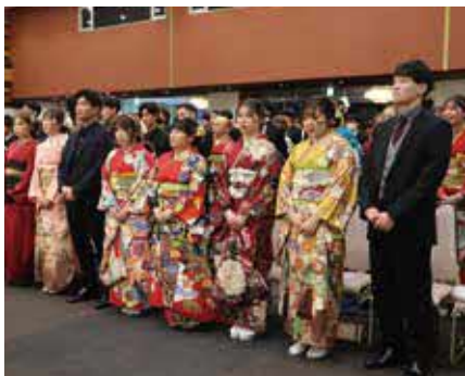
▲4年ぶりに声を出しての国歌斉唱