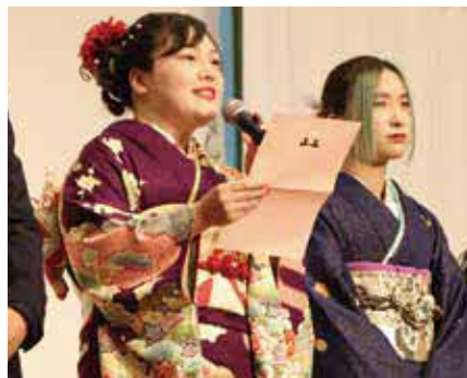
▲実行委員長のあいさつ