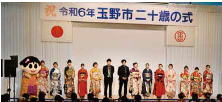
▲二十歳の式実行委員メンバーと市イメージキャラクターののちゃん ©いしいひさいち

1月7日(日)にダイヤモンド瀬戸内マリンホテルで二十歳の式が開催され、市内在住(出身)者551人のうち、382人が出席しました。 〓社会教育課 ㊟32-5577