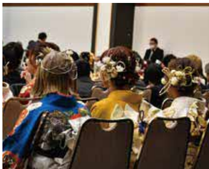
▲鮮やかな髪飾りが会場を彩る