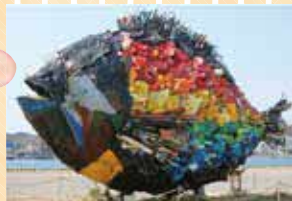
「宇野のチヌ」淀川テクニク