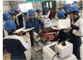
玉野市立商工高校

また、新規創業者への奨励金・補助金制度を設け、特に若者・女性・転入者の活躍を応援しているほか、IT関連等の新たな産業の誘致に向けた人材育成・環境整備やワーケーションツアーの実施により、産業の活性化を目指しています。