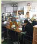
Y.S / 3年目

今では、女性の先輩作業員にご指導いただき、現場に向かい船内の修繕作業に携わっています。事務所の中では味わえない現場での緊張感や丁寧さを武器に作業しています。