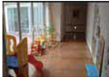
事業所内保育所（定員6名）