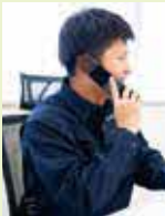
K・S / 4年目

ある一日 6:00 起床・準備・朝食 7:00 出勤 8:00 始業 8:30 朝礼と打ち合わせ 9:00 現場にて作業とディレクション業務 12:00 休憩 12:45 工程管理や安全配慮に関する書類の作成 15:00 クライアント企業や協力会社と打ち合わせ。または、翌日の準備 16:45 退社