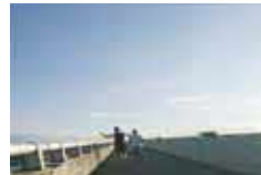
(マラソン大会にも出場しています。)