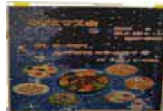
クリスマス会メニュー