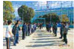
(ソフトボール大会)

ソフトボール後には家族で参加出来る輪投げ大会を行い、子供から大人まで楽しめる大会となっています。