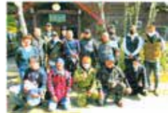
(社員の有志でツーリング)