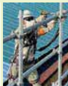
Nさん / 20年目

6:00 起床 7:30 出社 8:00 朝始業ミーティング、作業開始 10:00 小休憩 12:00 昼休憩（パワーを溜める為に昼食をしっかりと食べます！） 13:00 昼始業ミーティング、作業開始 15:00 小休憩 17:00 片付け、終業