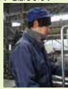
製造課 / 13年目