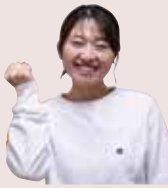
保育士 （会計年度任用職員）