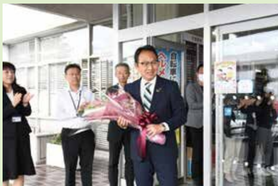
▲10月21日(火)に市役所で、登庁のお出迎えと 当選証書付与式を行いました。

令和3年10月に「玉野、再始動。」を掲げて市長に就任して以来、子育て支援や教育の充実、健康で元気に暮らせるまちづくりなどに取り組み、玉野市が安心して住み続けられるまちになるよう、市政運営に力を尽くしてまいりました。