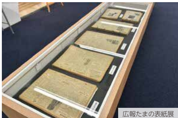
広報たまの表紙展

昭和25年11月に発刊された「報道たまの」を第1号として、以来75年間にわたって、市政情報をお届けしている「広報たまの」は、今月で1300号を迎えました。今後も、市民の皆さんに分かりやすく情報をお届けします。