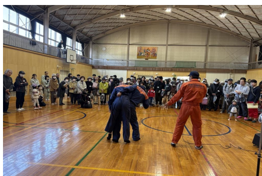
玉野市消防署による徒手搬送訓練