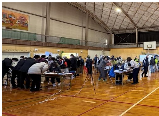
デジタル受付による実証実験の様子 N T T ドコモビジネスソリューションズ (株) 及び (株) バカンが実施したもの。