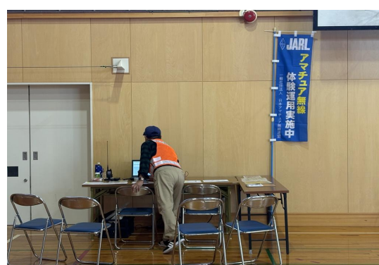
N P O 法人 V ネットおかやまによるア マチュア無線による情報伝達訓練