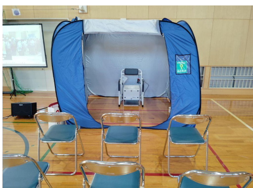
危機管理課による災害用簡易トイレ (ラップポン) の展示及び南海トラ フ地震の啓発ビデオの上映