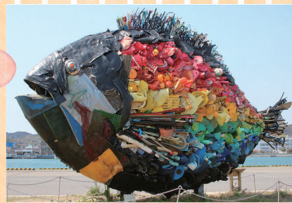
「宇野のチヌ」淀川テクニク