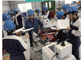
玉野市立商工高校