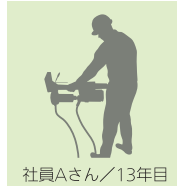
社員△さん / 13年目

岡山の大学で考古学を学んでいて、在学中の就職活動で地元岡山の企業へ就職を希望していました。取引先が大手企業や世界進出している企業ばかりですので安定していると考え入社しました。やりがいは、ミクロン(μm)台寸法の部品を完成させ、上司やお客様に喜んで貰えた時です。