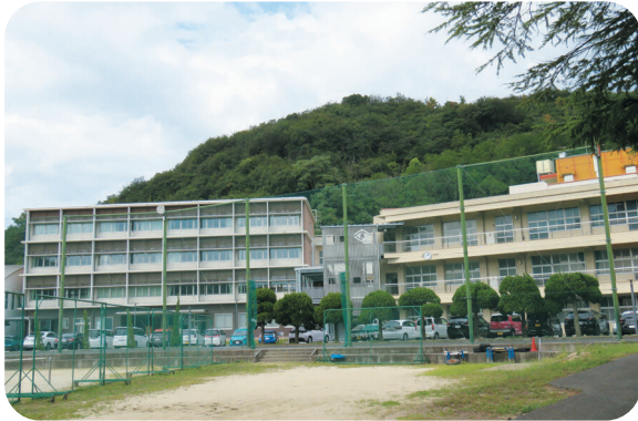
玉野商工高等学校

を対象に新生活のスタートアップに要する費用を補助する制度である。一定の要件の中で、賃貸住宅の家賃などに充てることができ、若い夫婦にとっては大変心強い制度だが、より重要なのは、この制度が本市への定住につながっているかどうかである。対象期間が1年間限りである当該事業について、定住推進の観点から、数年間にわたり補助を行うなど制