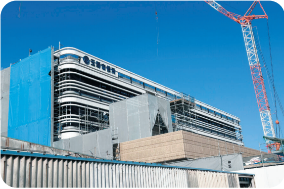
建設中の市役所本庁舎

れば計画も見直す必要がある。人口の3分の1が居住する庄内地区の全区長がハローズ進出に賛成しているという事実は、立地適正化計画が本来目的とすべき住民の幸福と現在の規制が乖離している証拠ではないか。 市長 ①ハローズの民間開発については、都市計画マスタープランに位置づける沿道サービスゾーンの考え方と整合を図っている「都市計画法に係る開発行為の許可の基準に関する条例」で定めた区域における計画であり、事業者が基準に適合した計画となるよう検討しているとのことである。 都市計画マスタープランとこの民間開発の対立はないと認識している。 建設部長 ②今後、高齢化や人口減少により、運転免許の返納などによる移動が困難となる高齢者が増加することや、市街地においても