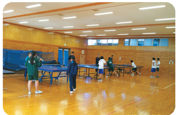
部活動の地域展開に向けた取組の様子

活動などの拠点となる市民会館の整備に当たり、多目的な複合施設とすることで様々な市民のニーズに対応でき、多くの人が交流し利用できる、そうした本市のシンボルとしてふさわしい施設になるのではないかと考えている。また、施設の複合化については、本年2月4日に行った芸術・文化関係者との新市民会館に関する意見交換会においても同様の意見があった。今後、新年度に予定している基本構想の検討委員会において様々な意見を聞きながら、施設の方向性や機能などについて検討を進めたい。