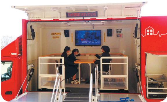
玉中学校での防災イベント（起震車体験）