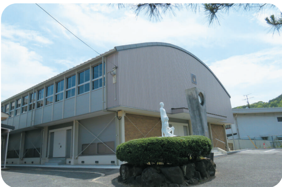
避難所に指定されている学校体育館

議員 ①避難所となる学校体育館への空調設備の整備計画について、岡山県内ではあまり進んでいない状況とのことである。災害は季節を選ばないことから、既に避難所になっている学校体育館へのエアコン設置は大変重要な課題である。文部科学省の交付金である空調設備整備臨時特例交付金の活用を行えば、施工の費用の面からも有利であると考えますが、所見を伺う。 ②異常な猛暑が毎年続いており、熱中症から命と健康