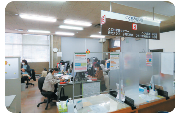
こども家庭センター（こどもみらい課）窓口

議員 ①市民会館の基本構 想において、当局の説明に よると、検討委員会は福祉 関係者も含めて構成し、社 会的処方(※)の視点も重 視しながら市民会館の役割 を議論することである。 近年、健康や安心は医療の みならず人とのつながりな ど社会的条件に大きく左右 されると言われ、芸術と医 療の連携の重要性が語られ ている。今後、市民会館を 文化施設としてだけではな く、芸術や文化が人とのつ ながりを生み、健康づくり や地域福祉にもつながる公 共施設と位置づけて議論す る考えはあるか。