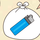
使い捨てライター

中身は使い切り、屋外などの風通しが良く、火気のないところで穴をあけてガスを抜いてください