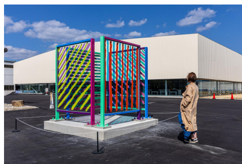
作品:Model of Something 作家:金氏徹平