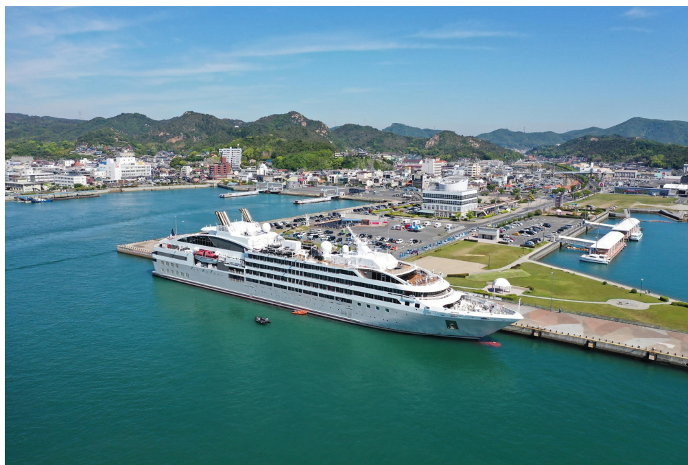
宇野港宇野地区に寄港したクルーズ客船