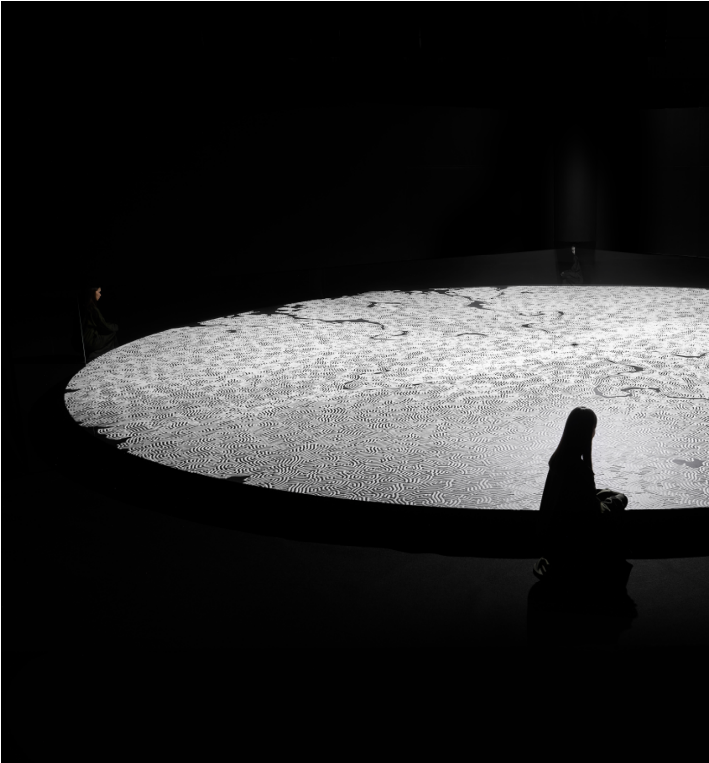
瀬戸内産業芸術祭 玉野市を拠点に、「産業＝アート（産業芸術）」を

玉野市は、岡山県の南端に位置し、瀬戸内海の美しい自然に恵まれた、風光明媚で温暖な気候の港町です。