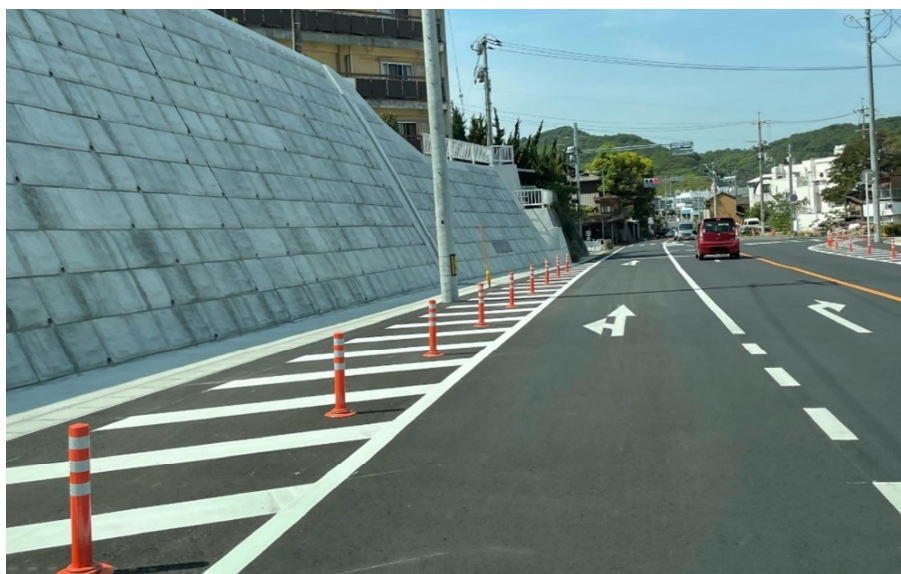
玉第一隧道交差点付近