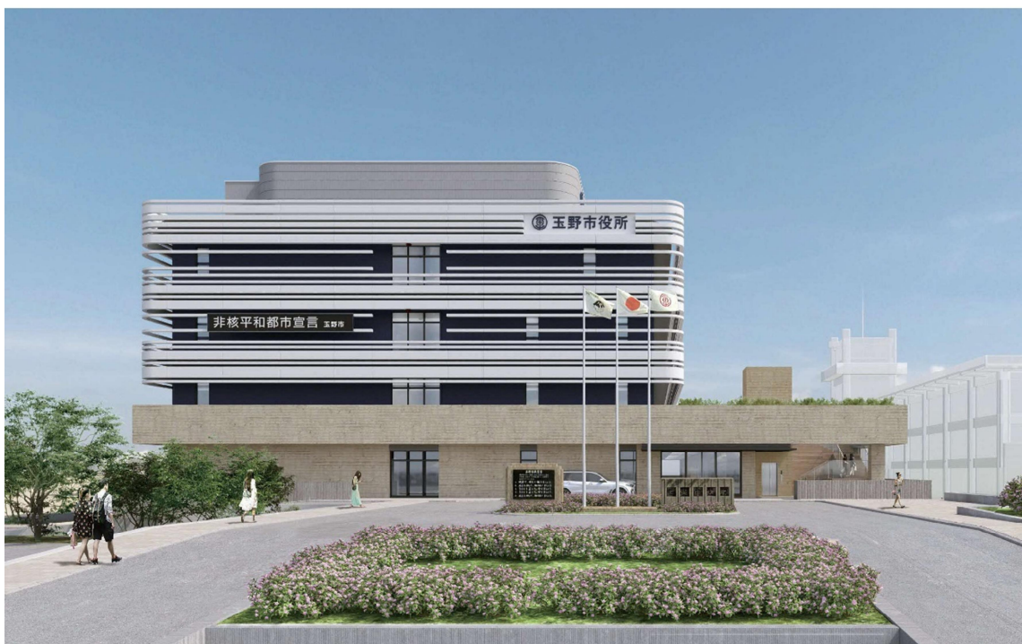
西側からの新庁舎正面イメージ