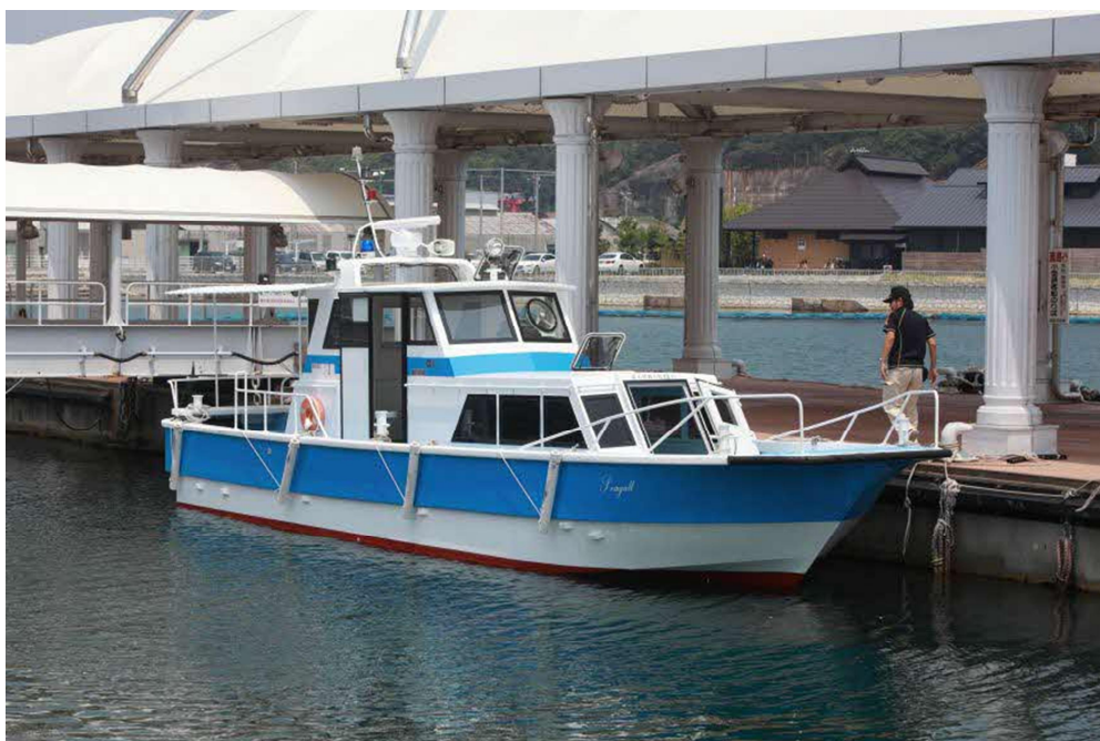
石島航路の船舶