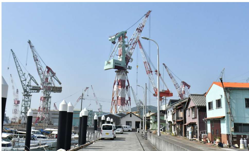
造船所のクレーン