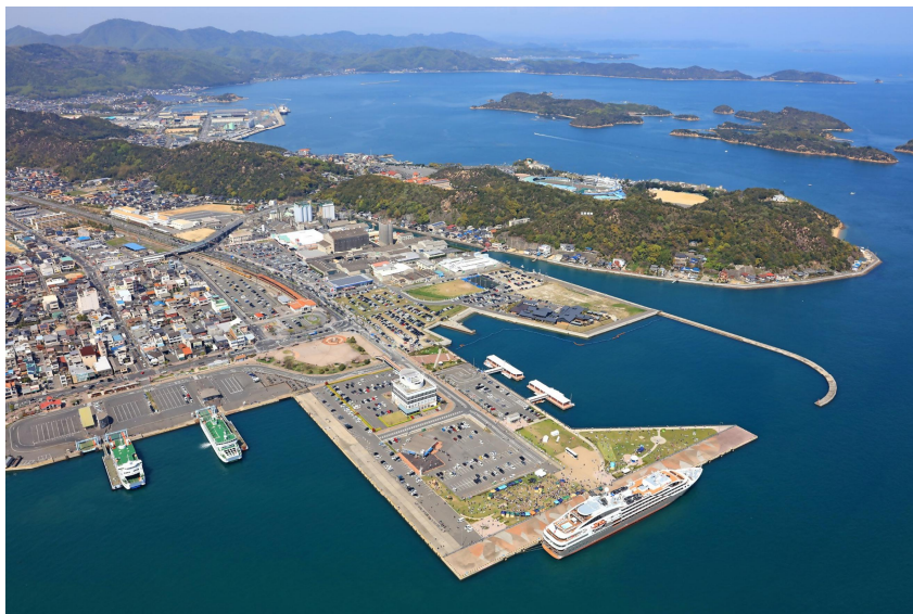
空から見た宇野港宇野地区