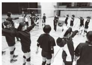
バレーボールの普及・発展・強化