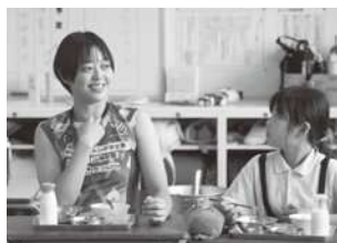
学校給食交流事業