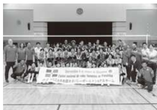
海外代表チームの強化合宿受入 (写真:ドミニカ共和国ナショナルチーム)

岡山シーガルズは国内バレーボール競技のトップカテゴリーであるSV.LEAGUEに所属するチームの中でも数少ない地域密着型市民クラブです。競技活動以外にもバレーボール教室や各種啓発活動、健康寿命延伸の取り組みなど様々な地域活動に積極的に取り組んでいます。