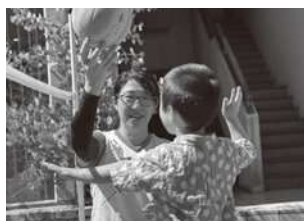
地域活性化や安全・安心なまちづくりへの取組 (写真:『こどもホコテン!』)