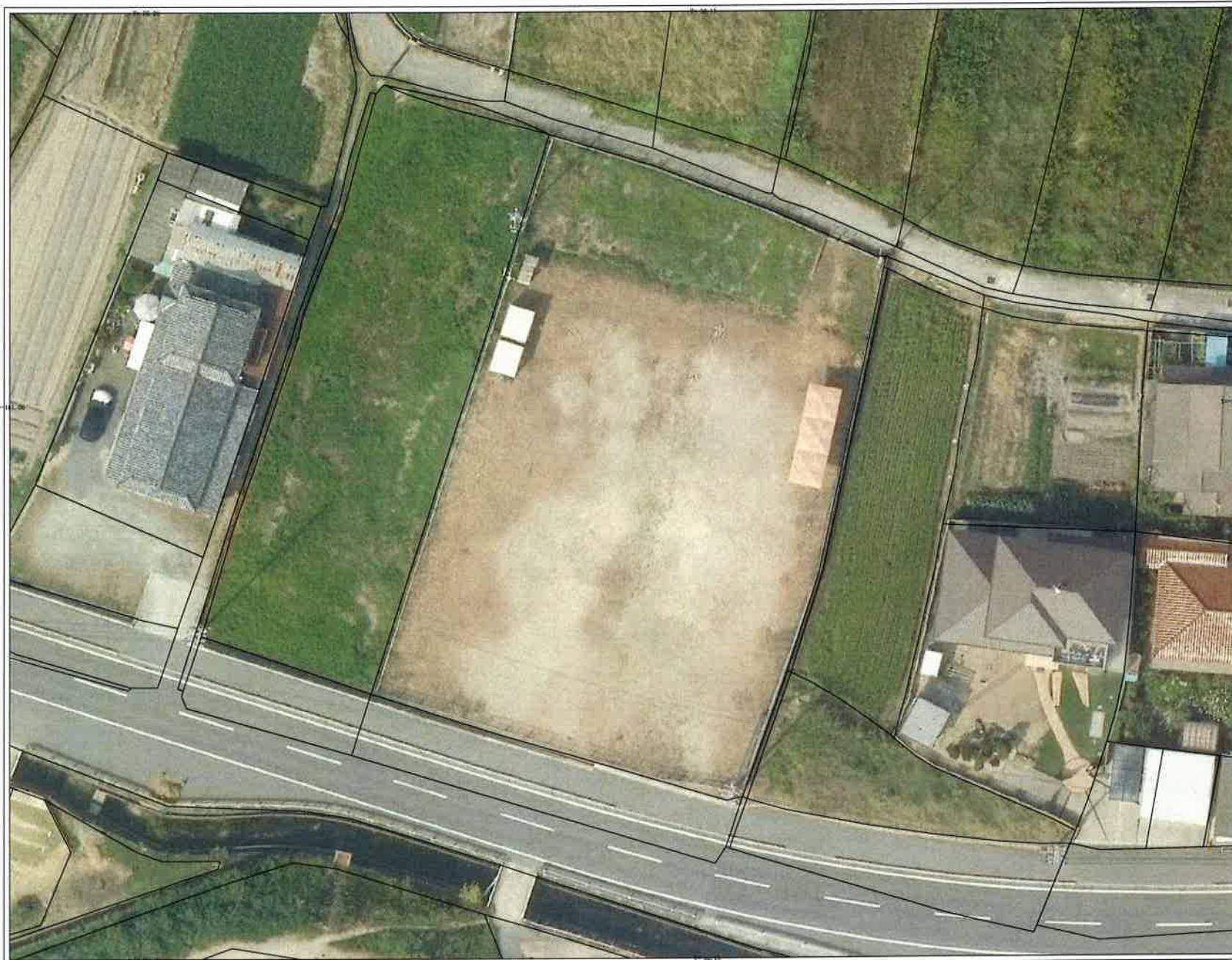
参考図面3 東分署事業用航空写真 (11月18日修正)